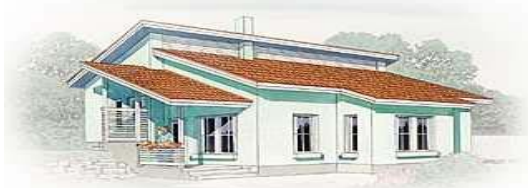
Yksikerroksinen porrastettu rinne- ratkaisu /Jukka-talo

Vaaituskartta on oltava lupahakemuksen liitteenä.