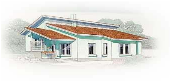
Yksikerroksinen porrastettu rinne- ratkaisu / Jukka-talo

Rakennukset suunnitellaan tontin korkeussuhteet huomioiden. Jos luonnollinen maapinta laskee rakennuksen matkalla yli metrin, rakennus on porrastettava. Vaaituskartta on oltava lupahakemuksen liitteenä.