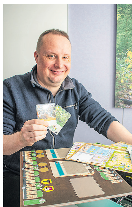
Ark Novassa rakennetaan eläintarhoja, suojellaan eläimiä ja houkutelaa asiakkaita. Strategiapelissä on satoja kortteja, eikä lainkaan noppaa.