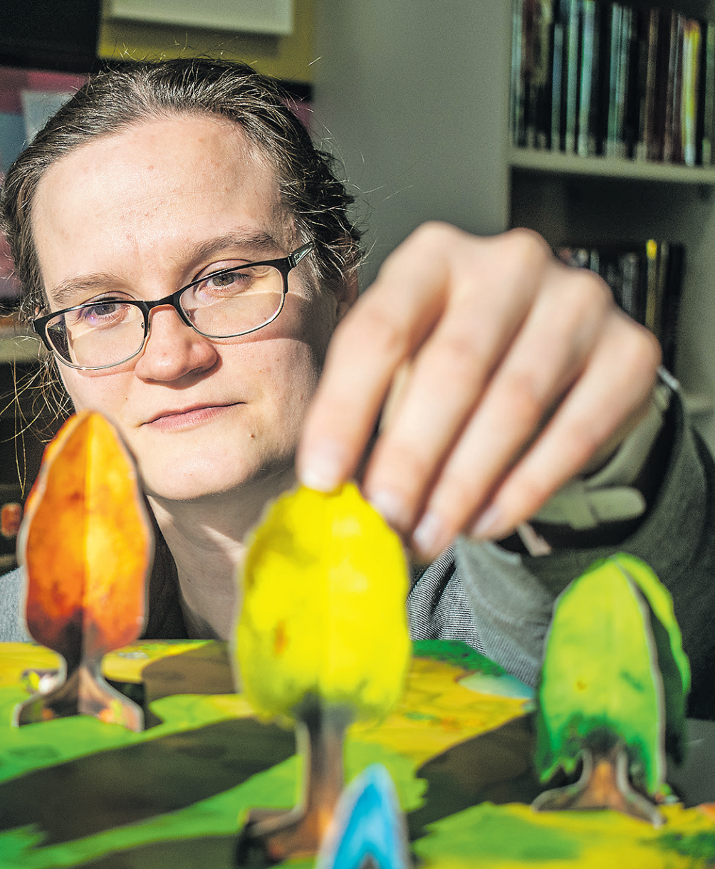
lautapelejä, korttipoleja ja PS4-pelejä. Peliviikolla kaikki ne ovat käytössä.