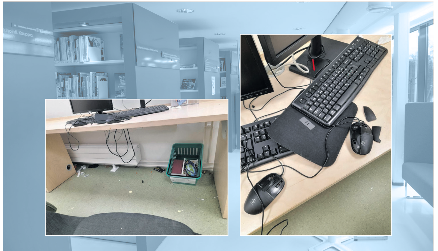
Esimerkkejä häiriökäyttötymisen jäljistä: roskaa lattialla ja särjettyjä laitteita.

Kinkomaan ohella myös pääkirjastolla on syksyn kelien viiletessä ilmennyt sekä iltojen että viikonloppujen omatoimiaikoina samankaltaista lähinnä alaikäisten aiheuttamaa häiriötä ja sotkemista. Tänä syksynä kirjaston laitteilla on tulostettu alaikäisille sopimatonta materiaalia. Kuvia on levitetty kylänraitilla.