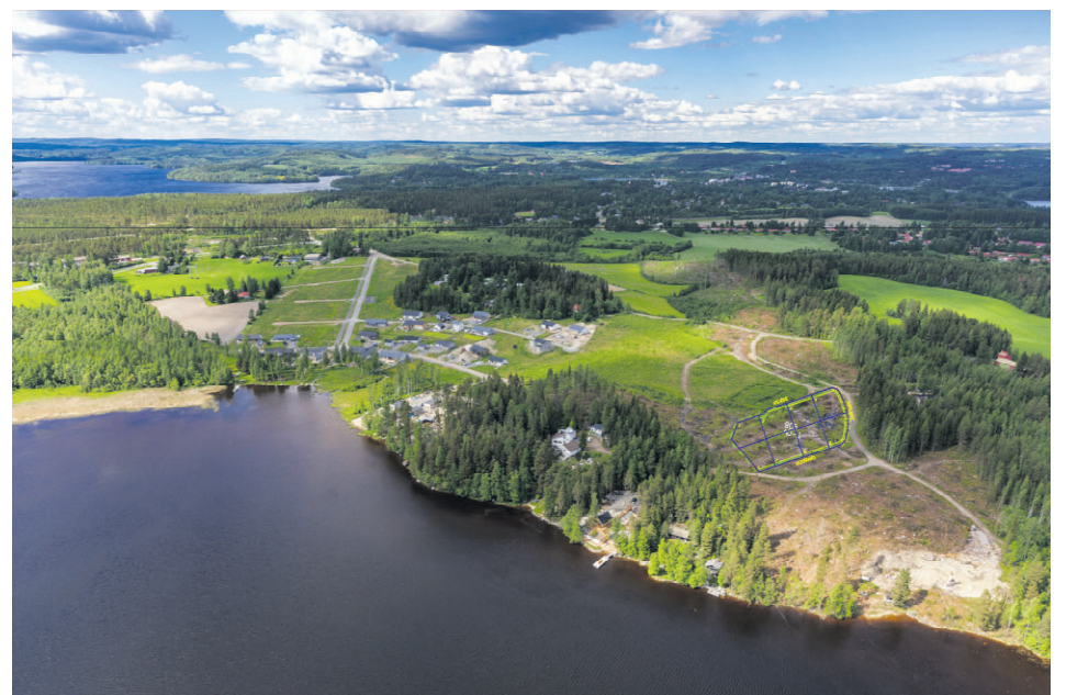
Uusia tontteja on kaavoitettu esimerkiksi Hautalahden.

– Vuotta on vielä jäljellä, eli pientä piristymistä on näkyvissä. Talouden epävakaus jarruttaa kuitenkin yhä rakentamista. Rakennus- ja tarvikekustannusten nousu on ollut voimakasta viiden vuoden aikasyklillä. Lämmöneristeiden hinnat ovat nousseet 30 prosenttia ja se sisältää niin routaeristeet kuin yläpohjan ja seinien lämmöneristeet. Niitä tarvitaan paljon, joten kustannusten nousu tuntuu. Myös erilaisten talovarusteiden hinnat ovat nousseet selvästi, Tammivuori toteaa.