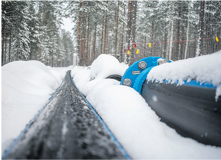
Tekopohjavesitutkimukseen liittyvät vesiputket kulkevat maan pinnalla Muuratjärven rannasta Muuratharjun päälle, jossa vesi sadetetaan maaperään.

– Tutkimuksessa selviää, mitkä alueet sopivat imeytyskäyttöön ja minne rakennetaan kaivot. Alueella tutkitaan esimerkiksi sitä, miten Muuratjärven vesi puhdistuu valuessaan maakerrosten läpi ja mihin suuntiin se virtaa, kertoo Suomen Pohjavesitekniikka Oy:n