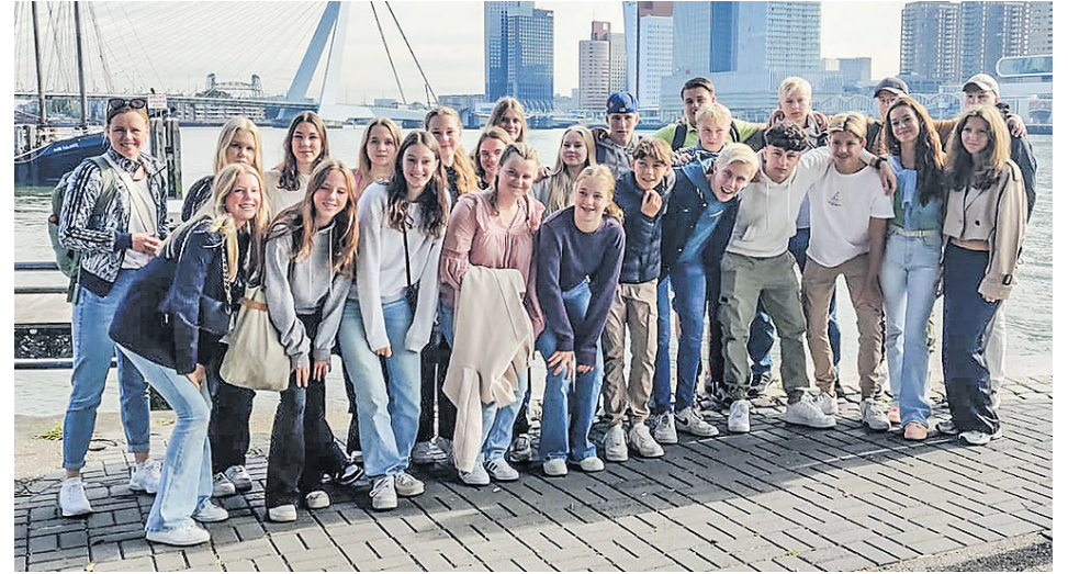
Muuramen lukion Erasmus + -ryhmä.

En ollut tehnyt vielä päätöstä teenkö valvonta-alan laitteita vai valaisimia, mutta molemmat niistä liittyvät näkemiseen. Siitä tuli assosiaatio "I see" ja näin keksin nimen Aicci.