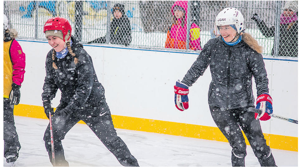
Koulun henkilökunnan ja kuudennen luokkien oppilaiden välinen jääkiekko-ottelu pelattiin uudella tekojällä perjantaina 1.12.

– Tänä syksynä kävi niin, että pohja ehti osittain jäätyä ennen kuin sitä päästiin kastelemaan, jolloin se ei enää jääty-