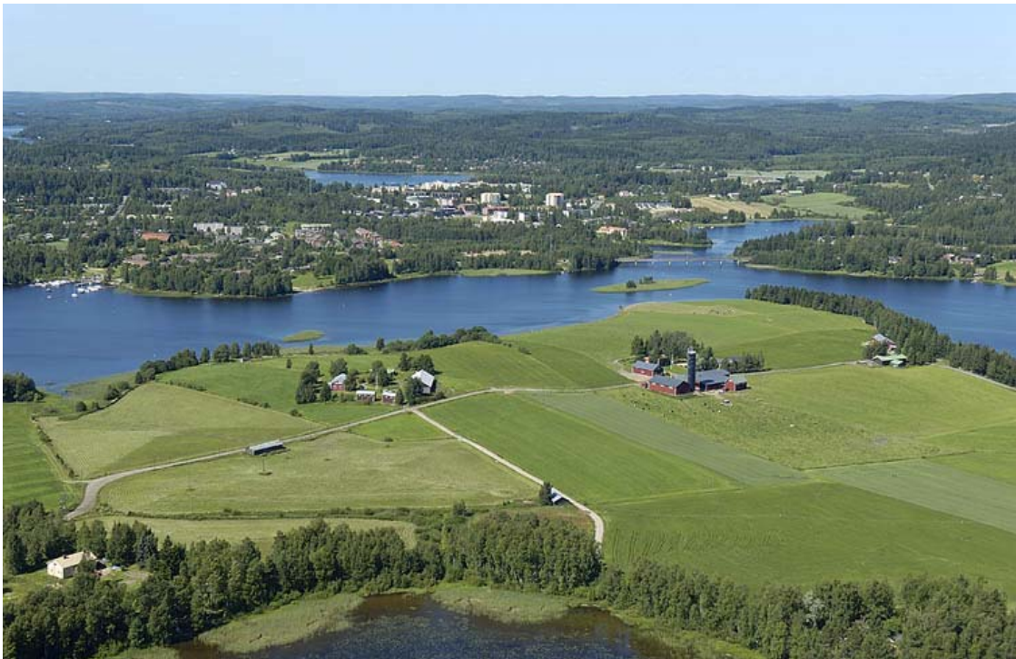
Etualalla Saarenkylän maakunnallisesti arvokasta kulttuurimaisemaa.