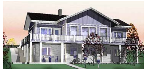
Jyrkän rinteiden rinnetalo / Tyyllitalot

Padotuskorkeuden alapuolelle jäävien tilojen viemärointi tulee hoitaa kiinteistökohtaisin pumppaamoin. Kaikki jätevedet, myös saunojen pesuvedet tulee johtaa kunnan viemäriin.