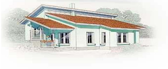
Yksikerroksinen porrastettu rinne- ratkaisu / Jukka-talo

Rakennukset suunnitellaan tontin korkeussuhteet huomioiden. Jos luonnollinen maapinta laskee rakennuksen matkalla yli metrin, rakennus on porrastettava. Vaatuskartta on oltava lupahakemuksen liitteenä.